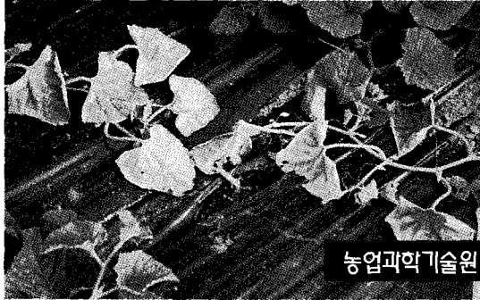
농업과학기술원 작물보호부 식물병리과