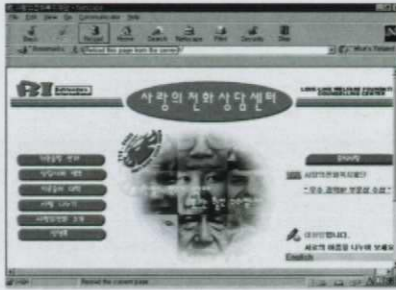
(그림 1) 사랑의 전화 상담센터 초기화면

상담서비스는 크게 3가지 종류로 편지상담, 온라인 상담, 상담사례뱅크로 분류된다. 편지상담은 자신의 고민을 적은 글을 전자우편을 통해 보내 오면 상담연구원이 24시간 이내로 답장을 작성해서 다시 보내는 형태의 서비스이며, 온라인 상담은 특정한 시간을 정해 온라인으로 내담자와 상담자가 서로 만나 문자로서 대화하는 것이다. 상담사례뱅크는 수천개의 상담 사례를 크게 8가지 주제(인생문제, 이성문제, 가족문제 등)에 따라 분류하여