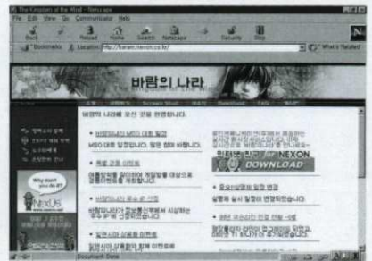
〈그림 4〉 바람의 나라 초기화면

'바람의 나라'는 무자비한 전투로 피가 난무하는 다른 게임들과 달리 협동과 사회성을 중시하는 스토리 전개로 건설한