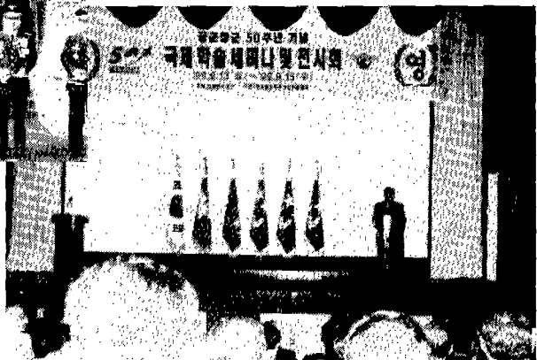
항공우주 무기체계 세미나 및 전시회가 공군주최 우리협회 주관으로 개최되었다