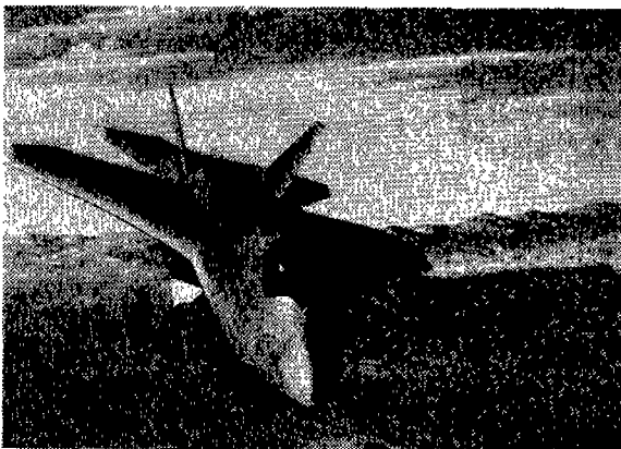
보잉사는 자사의 JSF 설계안의 무게 감소에 총력을 기울이고 있다

터키 공군에 인도되는 업그레이드 팬텀은 알타 레이더와 능동 전자전 시스템과 함께 이스라엘에서 개발한 각종 전자장비를 장착하고 있다. 이 업그레이드 계획은 2차로 나뉘어져 있는데 1차는 IAI에서 26대의 터키 팬텀기를 업그레이드해서 인도하고 2차로 나머지 26대를 이스라엘의 감독 하에 터