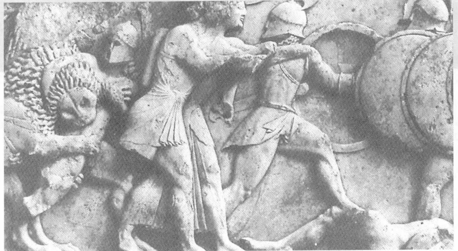
기원전 5세기의 아테네는 문화의 중심지였다.

소크라테스는 자신이 언제나 옳은 것을 말하고, 젊은이에게 좋은 영향을 끼쳤음에도, 여론이 자기를 사형시킬 것을 알고 있었다. 그는 자신의 '무기'를 버리고, 여론에게 아첨하면 살 수 있다는 점도 알았다. 그러나 그는 끝내 '무기'를 놓지 않을 것임을 분명히 했다.