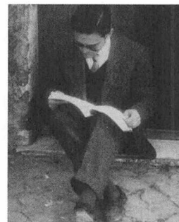
피에르 파올로 파졸리니

우리나라에선 널리 알려지지 않은 파졸리니. 시인으로서, 소설가로서, 영화감독으로서, 사상