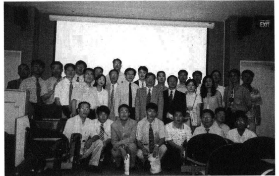
↑싱가폴 국립대학에서 자리를 함께한 참가자 및 관계자