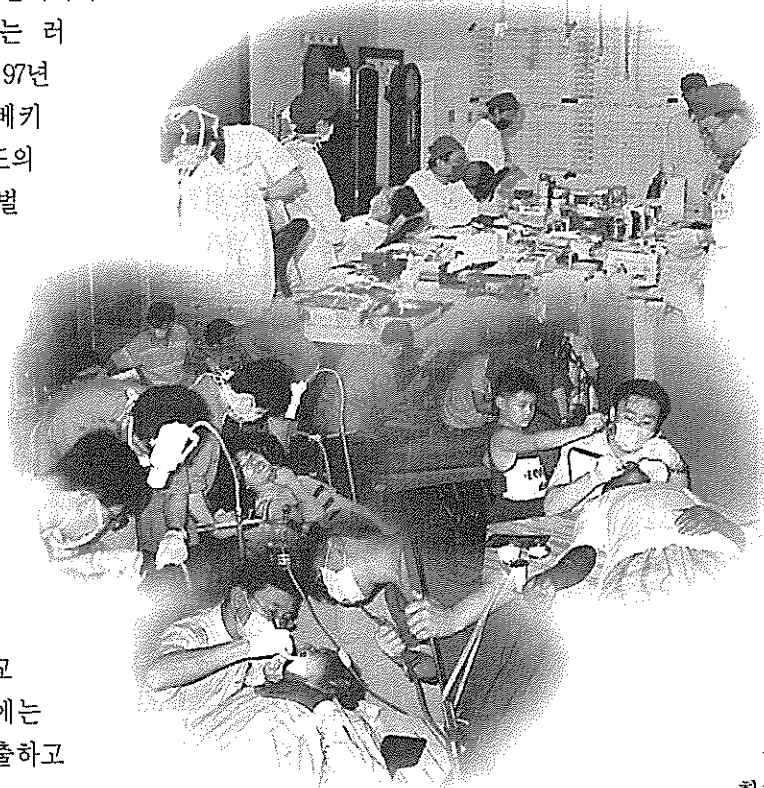
11개 치대의 진료 봉사동아리는 40여개에 이르며 이들은 국·내외에서 단기진료 또는 장기진료를 통해 봉사를 한다.(사진은 구리봉사회와 에셀의 진료모습)

이외에도 개인 및 단체에서 다양한 진료봉사 활동을 벌이고 있어 지역사회의 봉사활동 단체로의 이미지 심기에 주력하고 있다.