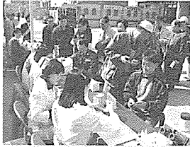
▲ 한국건강관리협회 검진차량 앞에서 시민들이 검진을 받고있다.