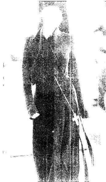
[그림 4] Donna Karen (Collezioni No. 35, pp. 265)