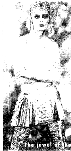
[그림 2] John Galiano(Collezioni No. 38, pp. 275)

대 이집트의 종교적 신비주의에 관한 사회적 관심의 고조는 최근 세기말적 패션에도 영향을 미치고 있다. 대표적인 디자이너가 John Galiano로 그의 '98 S/S 콜렉션은 투탕카멘묘를 재현한 무대에서 펼쳐졌다 22) . [그림 2]는 태양광선을 상징하는 주름 스커트 위에 이집트 왕족의 남자들만이 착용할 수 있었던 셴도트(Shendot) 23) 를 두르고 있는 John Galiano의 작품이다.