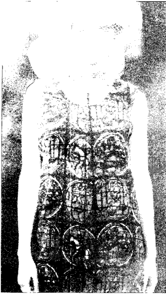
[그림 3] Comme Des Garçons (Collezioni No. 19, pp. 279)