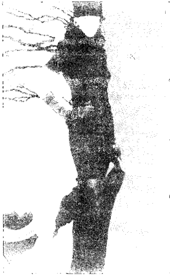
[그림 9] Collezioni 광고(Collezioni No. 42, pp. 287)