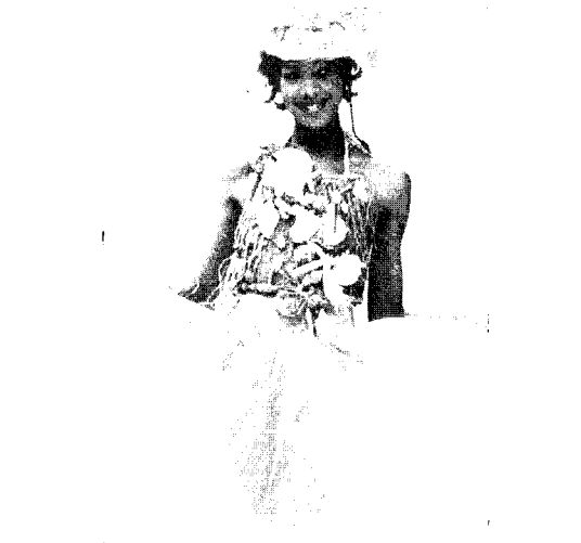
[그림 1] Tokubol Vol(Collezioni No. 38, pp. 275)

원시 종교인 샤머니즘에서는 동식물, 종족, 조상 등 다양한 대상들과 하나됨을 표현하고 있다. 원시 예술품에는 동물의 털, 식물뿌리, 조상의 머리털 등 자연물이 부착되어 있는 경우가 많은데, 실제 자연물들의 직접적인 이식은 정령의 실존에 대한 염원으로서 커다란 힘을 갖는다. 얼굴 전체를 모피로 덮는 가면, 새의 깃털을 주로 사용한 머리 장식과 부채 등 예술에 첨가된 자연물은 원시인들의 신화(神話)에 근거한다 19) . 이같은 원시 종교의 특성은 현대 패션에서도 차용되고 있으며 하지수 20) 는 이를 원시주의 양식의 '자연성'으로 분류하고 있다. 머리털, 깃털, 풀, 조개 등의 동·식물을 직접 부착한 원시주의 양식을 보여주고 있는 에스닉 또는 이콜로지 패