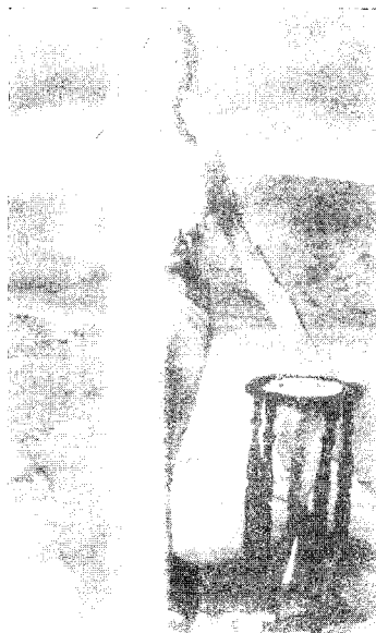
[그림 7] Versace (Vogue Korea, 1998년 9월호, pp. 37)