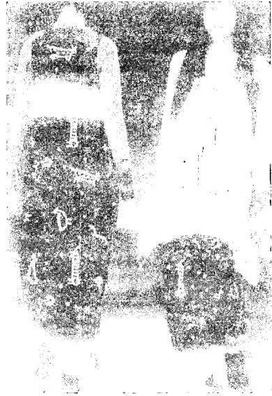
[그림 10] Tsumori Chisato(Collezioni No. 35, pp. 273)

나타난다 6) . 여자 마법사인 마녀는 유럽 민담에 나오는 추하고 심술궂은 노파로서 종종 마귀나 죽은 자들과 같은 존재로 간주되었다. 때로 아름다운 여인의 모습으로 나타나기도 하는 서큐버스(succubus)는 잠자는 남자와 성관계를 맺어 무시무시한 악몽을 꾸게 하고 남자를 탈진시켜버리는 마녀라고 한다. 대부분의 전승에서는 마녀가 다산(多産)을 가로막는 존재로 나오지만 마녀를 원시적 자연 여신의 한 잔재로 보는 학자들도 있다.