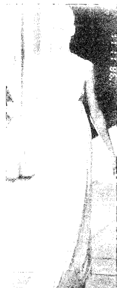
[그림 8] Istante (Collezioni No. 41, pp. 221)