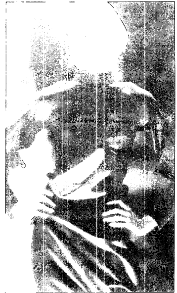
[그림 5] Alexander McQueen (Collezioni No. 65, pp. 53)

의해 인식되는 그림은 육신적 세계를 넘어 정신적 세계에 다다를 수 있는 수단이었다 29) . 이러한 신비 체험은 상징적 복식의 착용을 통해서도 가능하다고 생각되었다.