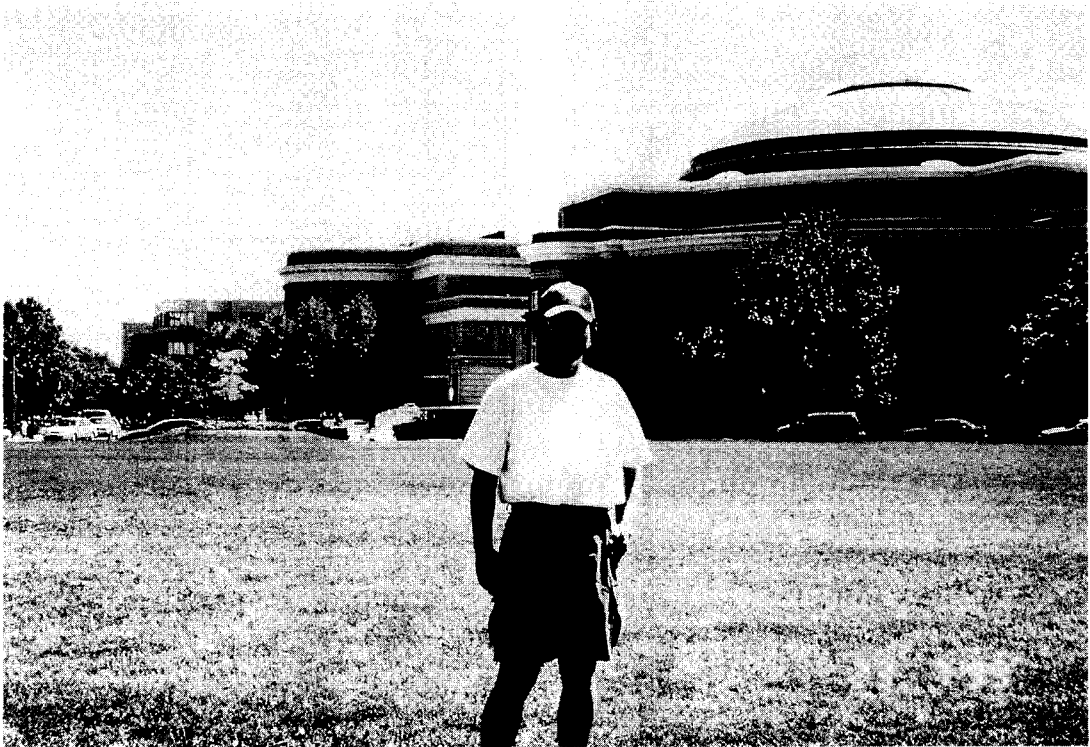
▲ - 토론토대학 교정에서 - 멀리 왼쪽으로 CN 타워가 보인다.

캐나다에서의 마지막 날이 시작되었다. 서울행 비행기가 밤 11시 50분에 출발하여 토론토를 둘러 볼 시간적인 여유가 생겼다. 묵은 호텔에서 나와 짐을 셰라톤호텔에 있는 짐 보관소에 맡기고 혼자 토론토 시내를 구경하였다. 오후에는 시내에 있는 University of Toronto를 찾았다. 국회의사당 옆에 위치한 토론토대학은 방학이라 학교는 붐비지 않았으나 도서관에는 학생들이 많았다. 넓은 캠퍼스와 고전적인 건물과 현대적인 건물이 잘 조화된 캠퍼스라는 인상을 받았다. 이 캠퍼스에서는 멀리 CN 타워가 한 눈에 들어왔다.