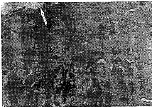
Figure 1. Photograph of skin tissue at 24 h after scald burn injury in rats, H & E, \times 200 . Apical surface (arrow) of tissue was not epithelial cells, because the epithelium with a few dermal connective tissue was left out. The cells consisted of hair root were necrosis (arrowhead), and dermal edema was found.

간과 피부의 조직학적 변화를 관찰하기 위해 편저로부터 조직 적출 즉시 10% neutral buffered formalin에 고정