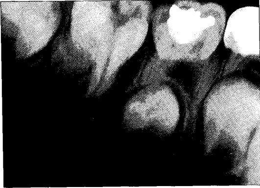
Fig. 7. Radiograph before treatment