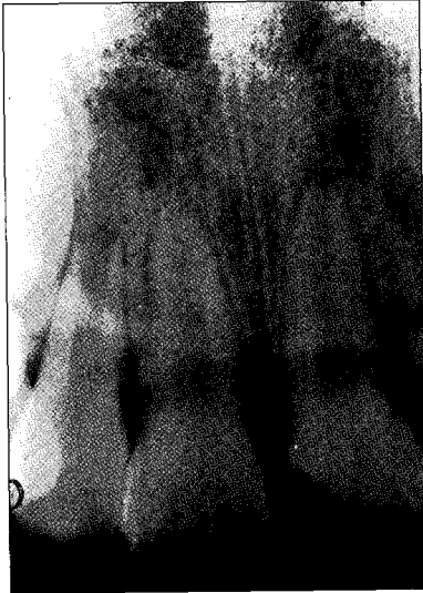
Fig. 3. Radiograph before treatment