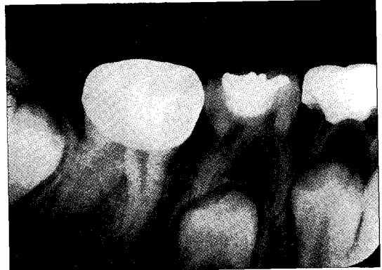
Fig. 8. Radiograph after treatment