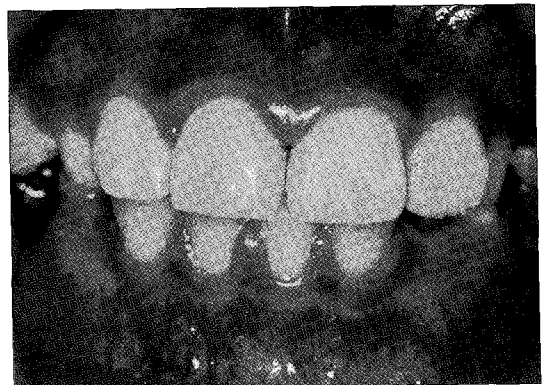
Fig. 2. Clinical photograph after treatment