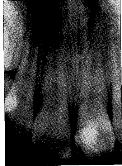
Fig. 4. Radiograph after treatment