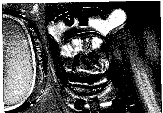
Fig. 6. Clinical photograph after treatment