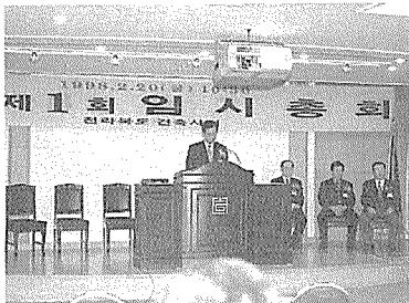
전라북도건축사회 정기총회 광경