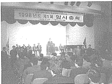
부산광역시건축사회 정기총회 광경