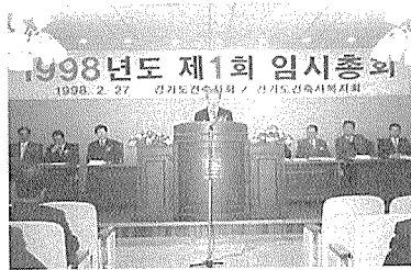
경기도건축사회 정기총회 광경