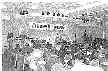
강원도건축사회 정기총회 광경

(안) 416,897,521원을 97회계년도 세출집행액인 364,092,120원으로 총액만 감액 결정하고 세입, 세출 항목별 계수조정은 간사회의로 위임 승인함