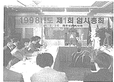
제주도건축사회 정기총회 광경

140,024,190원을 집행하로서 세입, 세출 차감잔액 17,313,823원을 98년도회계로 이월하여 결산