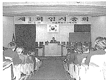
서울특별시건축사회 정기총회 광경