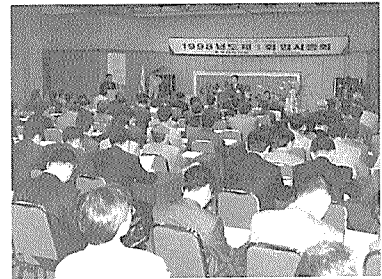
충청북도건축사회 정기총회 광경