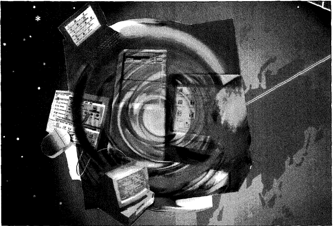
▲ ISDN은 각 단말기별로 서비스받던 전화, 팩스, 컴퓨터 등을 하나의 통합된 단말기로 서비스 받을 수 있는 종합정보 통신망이다.

이 이루어지고 있다. 사용자 망 인터페이스에 대한 규격은 완료된 상태이며 망 노드 인터페이스에 관한 규격의 개발이 이루어지고 있다.