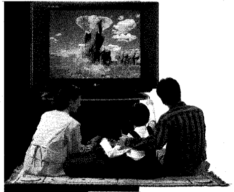
▲ TV는 지난 2년동안 판매는 줄었지만 대형제품 수요가 늘어 현상유지를 하고 있다.

는 99년까지 진행되는 교단선진화작업으로 인해 20만대 안팎의 교육용 특수를 기대할 수 있으나 조달청 납품가가 가전업체들이 수익성을 개선하는데는 도움이 되지 않을 전망이다. 한편 지난해 11월까지 19억달러의 실적을 기록해 96년에 비해 무려 32%나 뒷걸음질한 컬러 TV 수출은 올해 크게 호전될 전망이다.