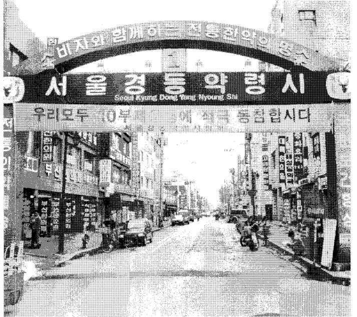
▲서울 경동약령시장. 토요일 오후인데도 약전골목이 썰렁하다.

수입 엑기스 반입량은 연간 약1천여톤으로 추정되고 있으며 이는 약재로 무려 4천여톤에 달하는 물량이다. 이와관련 생약협회는 수입