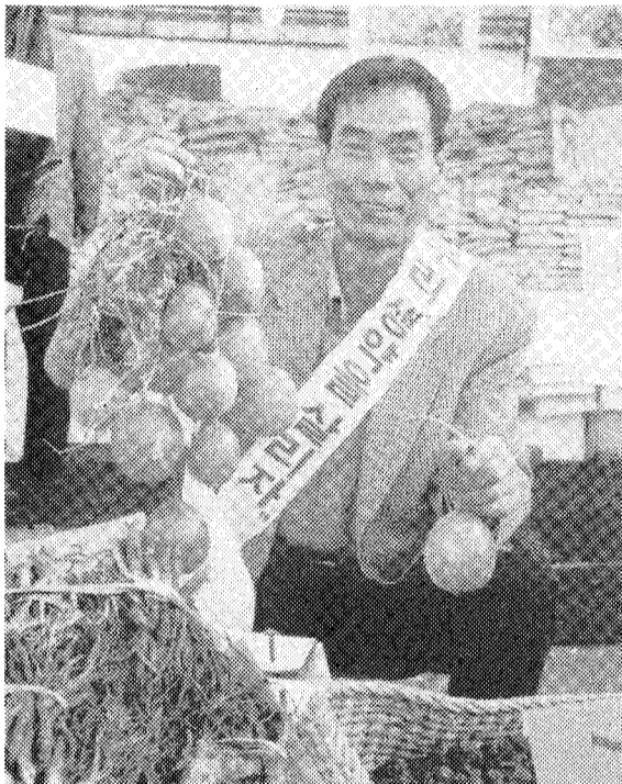
◇제4회 우수국산한약재 전시회에 출품한 하늘다리 약재를 들어보고 있는 한 회원(관련기사 6면)

국내산 참당귀 추출물 강효과가 뛰어난 것으로 밝혀졌다. 이 일당귀에 비해 탁월한 항암효과를 나타내는 데쿠루신과 다른 면역증강 물질인 이질인 사신의 농진정 함유 교수팀의 강원대 특