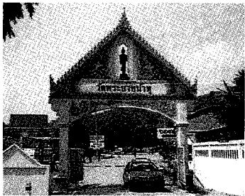
태국 롭부리주의 에이즈 환자 요양소 정문