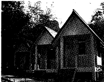
태국 에이즈 환자 요양소의 거처