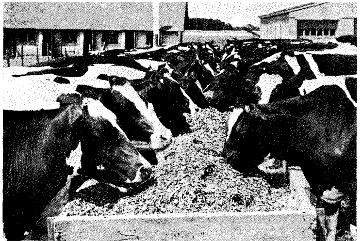
표7에서 보는바와 같이 현재의 IMF 사태가 2년내지 3년내에 해결이 될 것으로 예측하고 있으며 낙농산업은 급후에도 국가기간산

업으로서 성장할 것이라고 전망할 수 있으나 낙농가, 집유주체, 유가공품 생산주체등 각 주체의 과감한 구조조정이 이루어져야 하겠고 현재보다 한겹 또는 몇겹의 껍질을 벗겨낸 한단계 수준을 높이는 질적인 변혁이 있어야만이 가능하다고 판단된다.