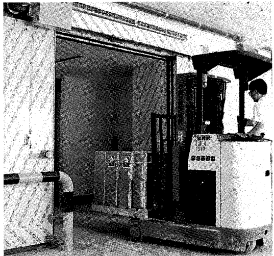
▲ 영림목재(주)의 자동창고용 파렛트(왼쪽) 및 냉동창고용 파렛트(오른쪽)