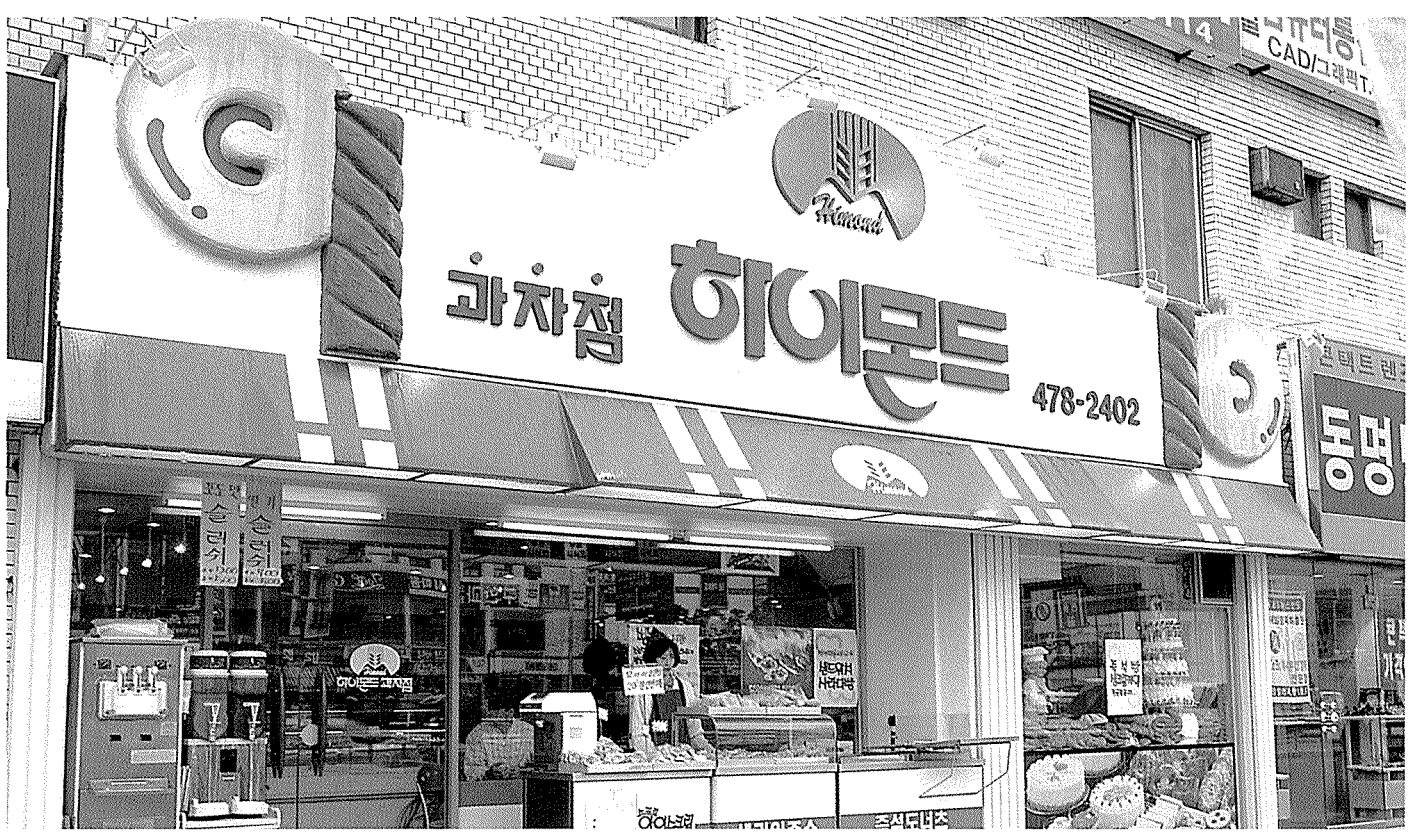
↑ 매장 외관 점두에 즉석코너를 설치해 도넛과 샌드위치를 직접 생산하고 있으며 생산한 지 12시간이 지난 빵을 진열해 20% 할인된 가격에 판매하고 있다.