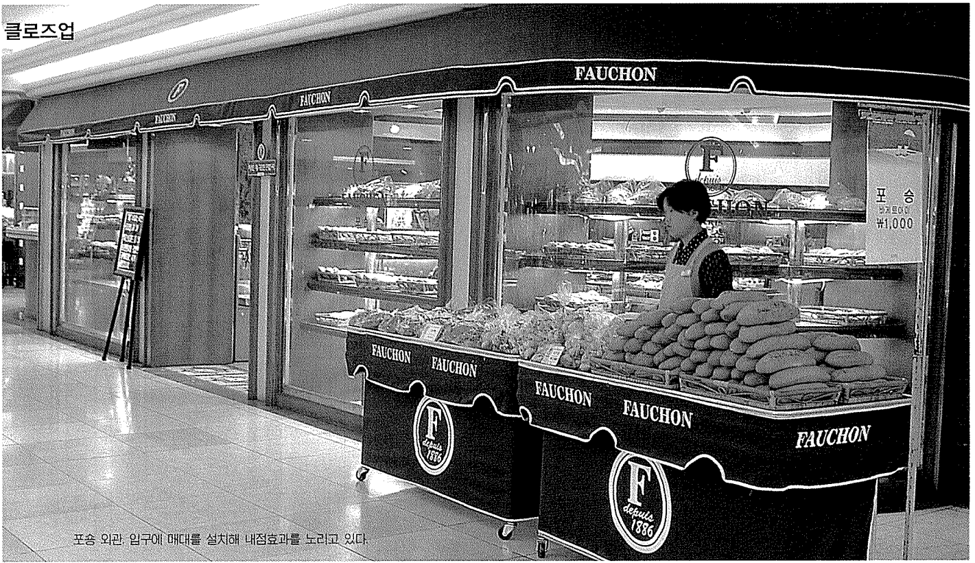
포송 외관. 입구에 매대를 설치해 내점효과를 노리고 있다.