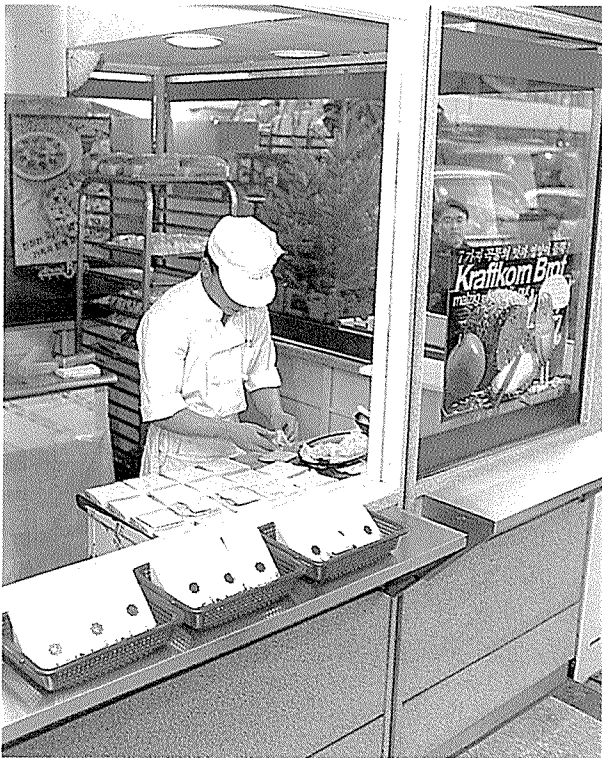
↑원가 절감 제품 출현은 업체나 제과점이 함께 위기를 함께 극복하자는 의지의 발로라는 점에서 의의를 찾을 수 있다.

다고 가정할 때 어떤 제과점이 3등급에서 4등급 제품으로 교체하면 판매가의 저하를 불러온다. 그런데 3등급과 4등급 사이에 새로운 신제품을 개발하면 매출 감소를 더 최소화할 수 있기 때문이다.