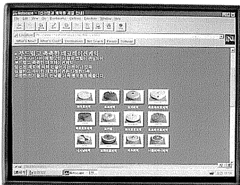
국내에서 개설된 베이커리 관련 홈페이지. 20여개 정도로 많지 않고 내용도 홍보 일색으로 아직 초보적 단계이다.

아직은 인터넷이 먼나라의 이야기일 뿐이다. 설령 어느 정도의 컴퓨터 활용 지식을 갖추었다 해도 외국의 베이커리 정보를 얻으려면 영어 및 전문 용어의 독해 능력이 필수적인데 이런 점이 큰 걸림돌이다. 이로 인해 프랜차이즈 업체나 양산 제빵업체, 대학, 베이커리 관련 정보