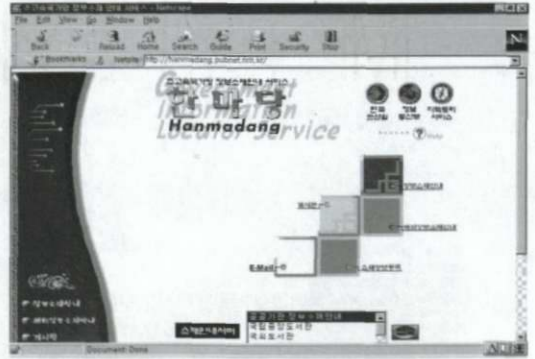
〈그림 3〉 한마당 서비스 초기화면

자치부에서도 행정정보소제 안내시스템 구축을 준비하고 있다. 이러한 정보소제 안내시스템이 정착되기 위해서는 법적·제도적인 관련 근거를 통하여 정보를 생산·보유하는 정부기관, 기타 정부관련기관의 자발적인 협조 체계가 이루어져야 하며, 국가적인 차원에서 효율적인 시스템 마련을 위한 메타데이터의 표준 제정 및 지속적인 현행화를 위한 제도 마련이 수반되어야 한다.