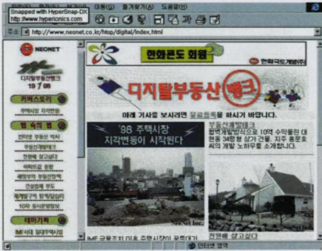
〈화면 3〉 네오넷에서 제공하는 인터넷 잡지인 디지털부동산뱅크 1월호의 한 장면