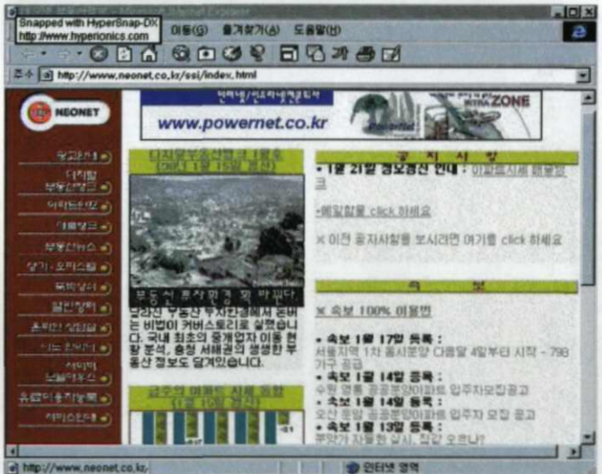
(화면 2) 분양속보와 아파트 시세동향 등 다양한 정보가 소개되고 있는 네오넷 부동산정보의 초기화면 (1월 23일 오후 방문자수 백만명 돌파)

에, 물건상황을 자유롭게 등록할 수 있도록 하여 부동산 직거래가 가능하도록 한 코너. 주의할 점은 이곳을 통해서 거래를 할 경우에는 상대방의 신원과 물건상황 등을 정확히 확인해야 한다는 것