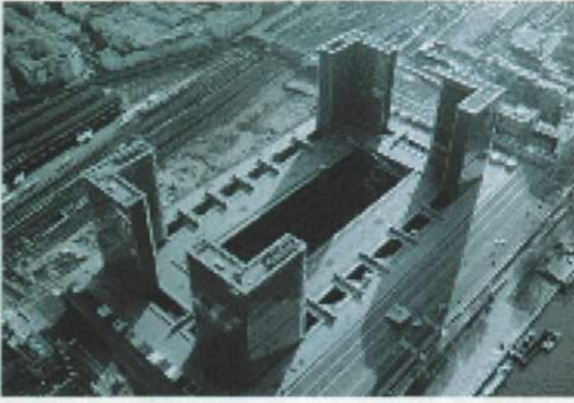
▲프랑스 국립도서관 건물 모습

갖추어 많은 도서에 비해 도서열람 신청후 보관창고에서 이용자에게 제공되는 시간은 보통 2시간 정도가 소요된다.