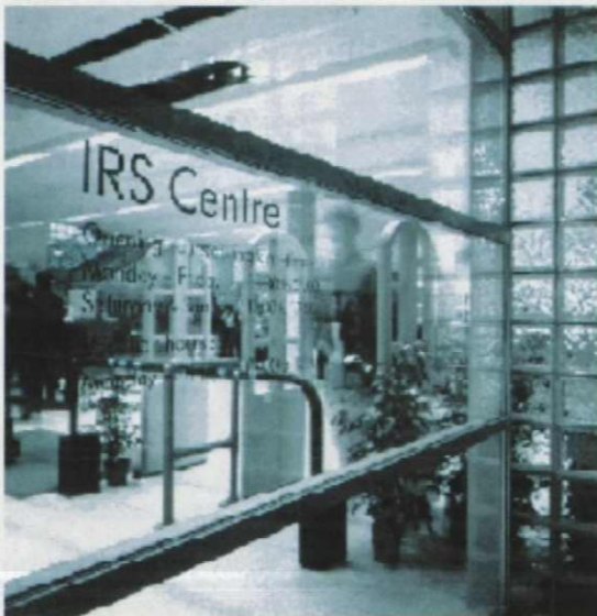
▲웨스트민스터대학교의 Harrow IRS Centre전경

웨스트민스터대학교의 Harrow IRS(Information Resource Services) Centre는 학생과 교직원에게 학습, 연구, 전자정보, 응용프로그램, 프린트, 복사, 팩스, 오디오/비디오/슬라이드 정보, 학습프로그램, 비디오/오디오 편집, 사진작업, 그룹토론 등의 서비스를 제공하고 있다. 여기서 제공되는 서비스는 대부분 유료이며, 과금시스템이 특히 잘 구축되어 있어 프린트, 복사, 디스켓 복사 등의 서비스