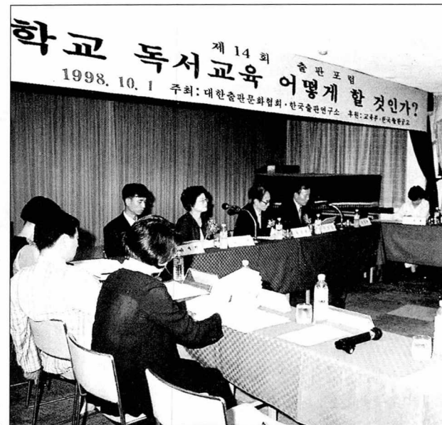
지난 10월1일 열린 출판포럼.

이날 포럼에서 가장 논란이 된 부분은 교육부가 추진하는 독서교육 활성화 방안이 과연 현실적인가 하는 점이었다.