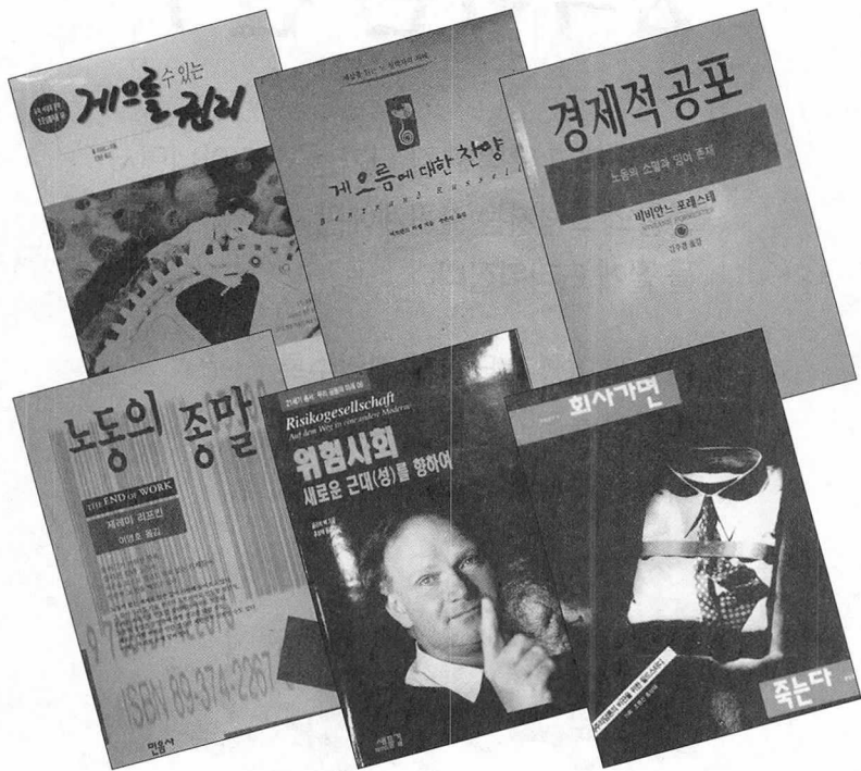
열심히 일한 직장에서 쫓겨나게 되는 노동자의 역설적 삶은 지금 이 시점에서 속고할 대상으로 대두되고 있다.

한없이 부풀어 오를 것 같던 풍선이 한순간 갑작스럽게 터져버리고, 곧이어 몰아닥칠 격랑을 우려하는 목소리들이 곳곳에서 들려오고 있다. 물가는 높은 폭으로 상승하겠지만 임금은 동결되거나 삭감될 것이라고 한다. 내년 봄에 우리는 다시금 '춘궁기'를 맞게 될 모양이다. 그러나 더욱 우려가 되는 것은 100만명 이상의 실업자들이 발생할 것이라는 예측이다. 이 수치는 기준을 어떻게 잡느냐에 따라 200만명 이상으로 늘어날 수도 있다. '4월은 잔인한 달'이라는 시구가 비유나 상징이 아니라 절박한 현실이 되는 것이다.