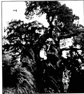
▶ 곱향나무 쌍향수

상이며, 좌우에 가섭과 아란이 배치되고 본존대좌 밑에 반나체의 시자(侍者)가 공양을 올리고 있다. 오른