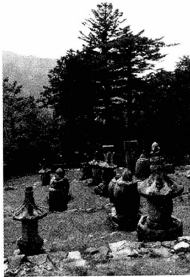
▶ 大德高僧 사리탑

로 아름다운 경관을 창출하고 있다. 이를 지나 천왕문을 들어서면 종각과 박물관이 있고, 이를 지나면 보물 제302호로 지정된 약사전(藥師殿) 건물이 있다. 1칸짜리 정방형 법당인데 대들보가 없고, 공포와 도리리만 짜올린 우리 나라 법당 중 제일 작은 조선중기 건물이다. 약사전 옆에 영산전(보물 제303호)이