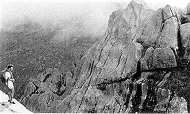
Itatiaia National Park