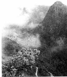
Machu Picchu National Park