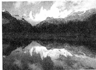
Los Glaciares National Park