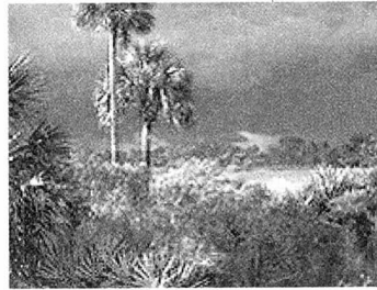
Sierra Nevada de Santa Marta National Park