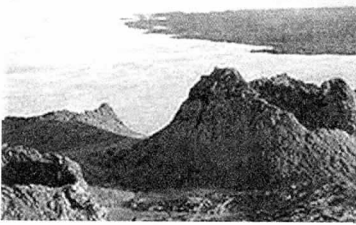
Galapagos National Park