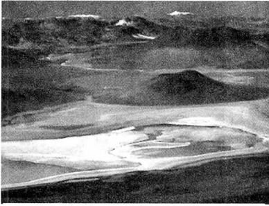
Laguna Vordo National Park