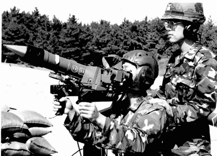
▼ '92년 프랑스에서 도입해 운용중인 Mistral 대공유도 미사일

제작사는 IPTN사이며, 스페인 CASA사에서 도입 운영중인 기종과 동일형이고, 성능으로는 순항거리가 약 3,000여km, 화물 및 병력