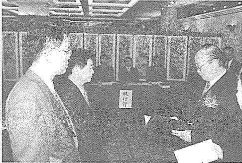
▲ 협회 유관인사 감사장 수여