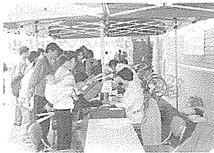
충북지는 지난 10월 16일부

터 20일까지 5일간 농협 청주 물류센터가 개장된 상당구 용암동 물류센터에서 센터 이용 고객 700여명을 대상으로 무료 건강검진을 실시했다.