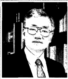
장 수 영 포항공과대학교 총장

대외경쟁력 강화에 역행하고 있는 요소는 여러 가지가 있으나 대학이 사법고시 준비장과 취업 준비장으로 변하고 있다는 점이다. 특히 공대생 중에서도 사법고시준비를 하고 있는 점은 우리가 다 같이 반성할 점이다.