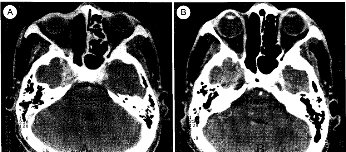
Fig. 2. A ; 38 years old male patient with recurrent maxillary sinus cancer involving skull base. B ; complete response after FFSRT.

전체 7례중 5례에서 방사선학적으로 완전관해를 보였다(Fig. 2). 이중 첫 례는 근치적 방사선치료후 34개월 만에 재발한 비인강종양이 접형동(sphenoid sinus)과 해면동(cavernous sinus)를 침범하는 비인강종양환자로, 재치료로서 과분할방사선치료 24Gy(1.2Gy/fraction, bid)후 16.25Gy의 FFSRT를 시행받고, 12개월 후 표적용적의 경계 및 밖에서 재발하여 구제화학요법을 시행받았으나 반응이 좋지않았고 결국 재치료 24개월만에사망하였다. 두번째 환자는 3회의 유도화학요법 및 근치적 방사선치료후 두개기저부 재발한 미분화성 비인강종양환자로 22.5Gy의 FFSRT후 국소관해상태에서 치료후 6개월만에 심한 위장관출혈로 사망하였다.