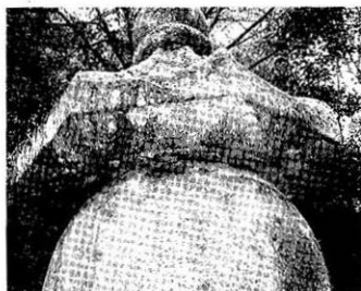
Fig. 3. Mottled color by pervasive moss of different kinds and trace of a moth cocoon (Hwanjeogdang Stupa, Chunchon, Kyongju)