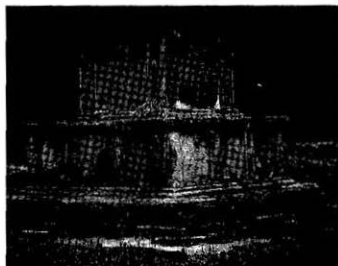
Fig. 2. Bleaching due the dissolution and exfoliation along onion structure by chemical weathering of granite (Gameunsa three-story pagoda, East one, Kyongju)