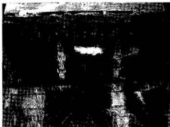
Fig. 1. Bleaching phenomena by weathering of carbonate rocks and dissolved material flowing downward effected on rock (Wongag-sa 10-story pagoda, Seoul)

상기한 바와 같이 여러 요인들에 의해 풍화작용이 진행되어 암석을 이루는 광물이 용해되거나 새로운 광물로 변하며 동시에 광물입자들이 분리되어 떨어지는 등 여러 가지 암석의 성질에 변화가 일어나게 된다. 화학적 풍화에 의해 광물의 구성성분중 부분적으로 용해되어져 나가고 남은 부분은 새로운 환경에 안정된 새로운 광물이 생성되어 잔류되기도 한다. 광물의 용해작용이 우세하게 일어나는 경우 암석표면은 마치 표백된 것과 같은 현상을 보이기도 하며 이러한 용해작용이 부분적으로 일어 나는 경우 아래로 흘러내리는 용해물진에 의해 이차적으로 영향을 받기도 한다. 때로는 이러한 화학적 풍화작용에 의해 생성된 용액으로부터 새로운 광물이 이차적으로 생성되기도 한다. 이러한 경우는 주로 석회암이나 대리암과 같은 경우에 잘 일어나며 이는 구조물의 부위에 따른 pH 나 Eh 등과 같은 물리·화학적 조건의 차이에 의한 것이다. 이러한 예는 원각사 10층 석탑 (Fig. 1)에서 잘 관찰할 수 있다. 또한 광물의 화학적 붕괴와 습기는