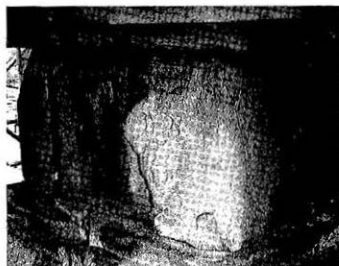
Fig. 4. Exfoliation along onion structure by weathering developed in granite (Gameun-sa three-story pagoda, East one, Kyongju)