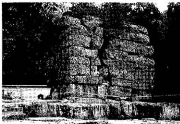
Fig. 6. Structural instability due to both depression in places by differential loading and soil creep rightward in the basement(Jungwon Mireugri-saji stone-chamber protecting stone-buddha, Jungwon-gun)

나라 암석 물성의 약화에 따라 구조물 전체의 하중에 편중이 야기되어 구조적 불안정이 생기게 되며 이는 또 다시 하중의 편중을 심화시키는 결과를 가져오게 된다. 따라서 편중된 하중에 의하여 암석에 이차적인 균열이 발달하게 되며 이를 따라 풍화작용이 더 심하게 진행되어 균열은 더욱 커지게 된다. 이러한 과정이 반복되고 심화되면 결국 전체적인 구조적 불안정이 야기되어 크게 깨어져 나갈 수도 있다. 이러한 현상은 증원 미륵리 사지 입상석불 보호석실 (Fig. 6)에서 잘 관찰할 수 있다.