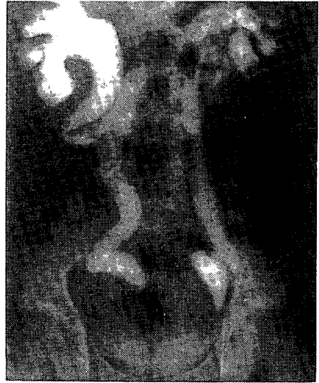
Fig 4. Retrograde urethrography shows dilatation of both renal pelvis and ureter.

으나 요로감염이 재발되어 다시 입원하였다. 이때 비신경인성 신경인성 방광 증후군으로 진단하고 신경성 방광 소견이 심하여 배뇨 훈련을 시행하였으나 다뇨와 요의 농축기능 소실은 호전되지 않았다. 증상의 호전이 없어 치골상부방광조루술을 시행하였다. 4개월 후 본원 비뇨기과에서 양측 요관방광문합술 (ureteroneocystostomy)와 방광성형술을 시행했고 주간에는 카테터를 막은 후 배뇨하는 훈련을 하고 있으며 현재는 요로 감염의 재발 없이 외래로 관찰 중이다.