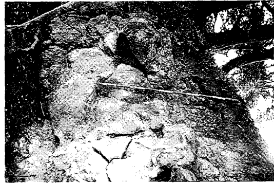
Photo 4. Soil eroded slope at the main community of Machilus thunbergii

삼림토양의 평균 pH 5.5(이수옥, 1981)에 비해 매우 약한 산성을 나타내고, 활엽수 생육의 최적 pH인 5.5~6.5와 비슷한 수치를 나타내어 후박나무의 생육에는 최적의 토양조건이라고 할 수 있다. 유기물 함량은 주군락지의 0~20cm층에서 4.76%로 가장 많고, 소군락지와 수성당 부근의 표토층에서도 각각 3.52%와 2.69%로서 비교적 많은 편이며, 주군락지의 경우 토심이 깊어질수록 함량이 감소하였다. 전질소와 유효인산의 함량도 표토층에서는 비교적 많은 편이다. 토양의 보비력을 나타내는 중요한 척도인 양이온치환용량도 표토층에서 19.20~26.00me/100g으로서, 변산반도 내륙 삼림지대의 평균 15.20me/100g(고대식 등, 1991)과 우리나라 삼림토양의 평균치인 11.34me/100g 보다 훨씬 높고, 치환성염기인 K^+ , Ca^{++} , Na^+ , Mg^{++} 의 함유량도 많은 편이다. 그러나, 유기물, 전질소 및 유효인산의 함량은 모두 변산반도 내륙 삼림지대의 평균치(고대식 등, 1991)에 비해 작은 편이다.