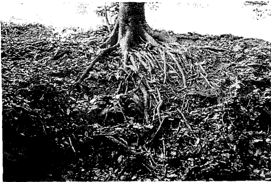
Photo 3. Root denudation of Machilus thunbergii at the main community