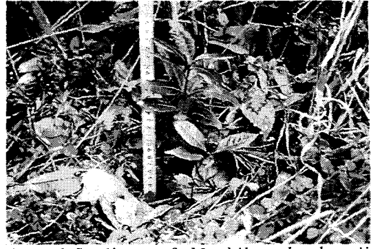
Photo 6. Saplings of Machilus thunbergii at the main community