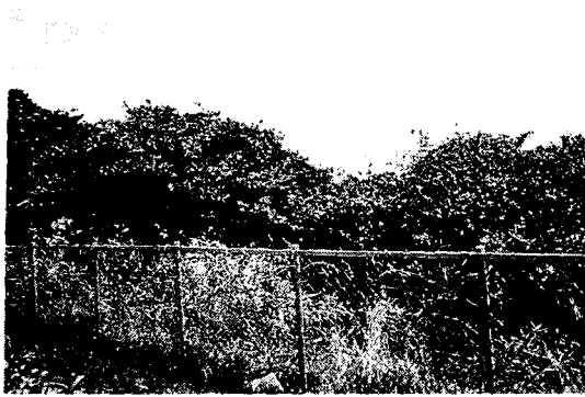
Photo 5. Crown damage by cold wind at the main community of Machilus thunbergii

피해를 계속 받아 북쪽 가지가 동해를 입어 심하게 손상된 상태이다(Photo 5).