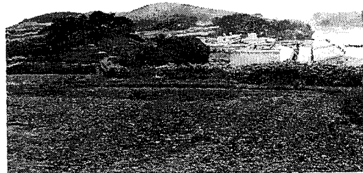
Photo 1. Topographic condition around the Machilus thunbergii community

Symbols for regions are as follows; 1 Kisangbong(peak), 2 Puan dam, 3 Pyonsan beach, 4 Vitex rotundifolia community, 5 Machilus thunbergii community, 6 Kyokpo, 7 Ilex cornuta community, 8 Komso, 9 Naesosa(temple), 10 Chikso water fall, 11 Ilex crenata var. microphylla community