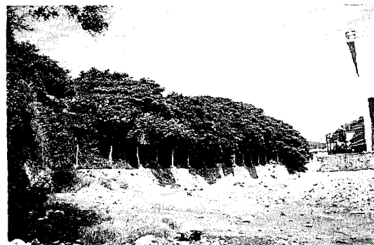
Photo 2. The main habitat of Machilus thunbergii community