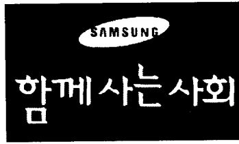
[그림 2-5] 삼성의 함께 하는 사회