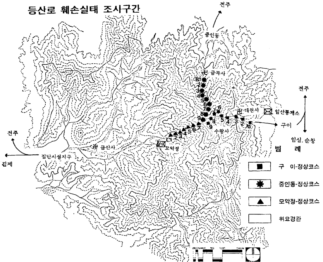
Fig. 1. Location of survey site and plots in Moaksan Provincial Park.

에 오르는 3개의 주요 등산코스를 대상으로 다음과 같이 조사구간을 선정하였다.