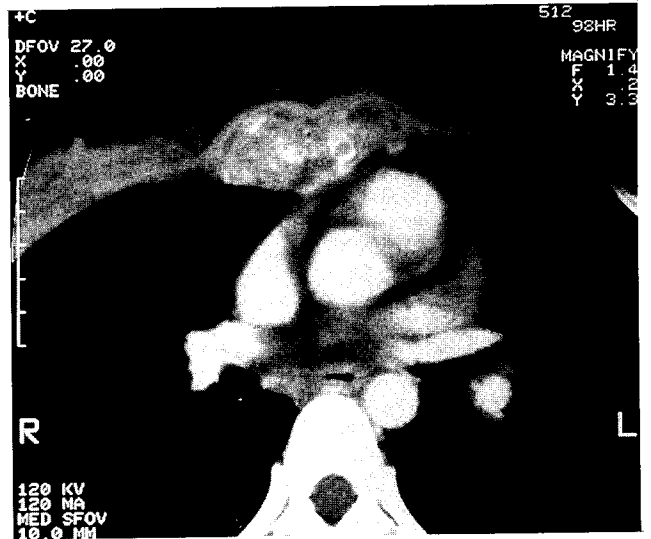
Fig. 2. Preoperative chest CT showed severe ternal necrosis and periosteal expansion