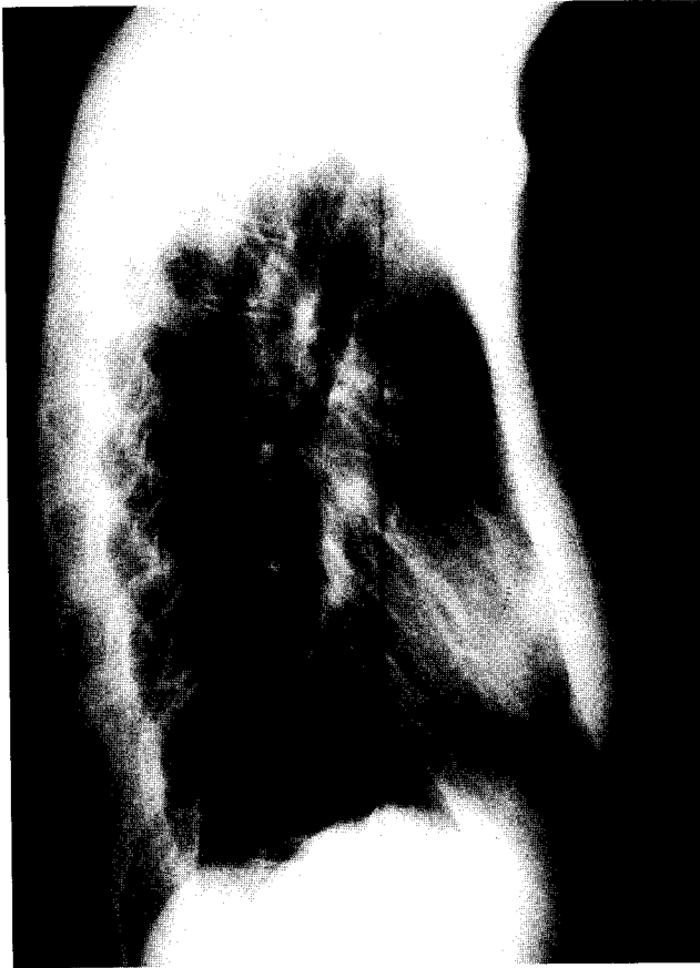
Fig. 1. Preoperative chest lateral view showed sternal bony defect and soft tissue swelling