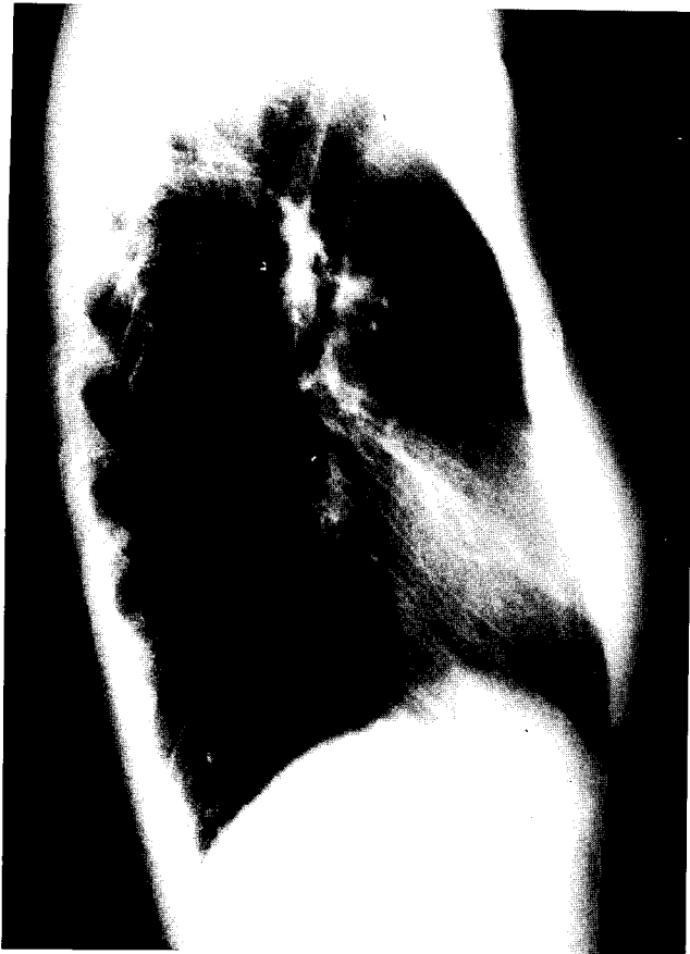
Fig. 4. Postoperative chest lateral view showed sternal continuity with autogeneous iliac bone.

병리학적 소견상 만성 육아종과 치즈양괴사가 동반된 결핵성 골수염으로 진단되었으나 검체에서 결핵균은 검출되지 않았다.