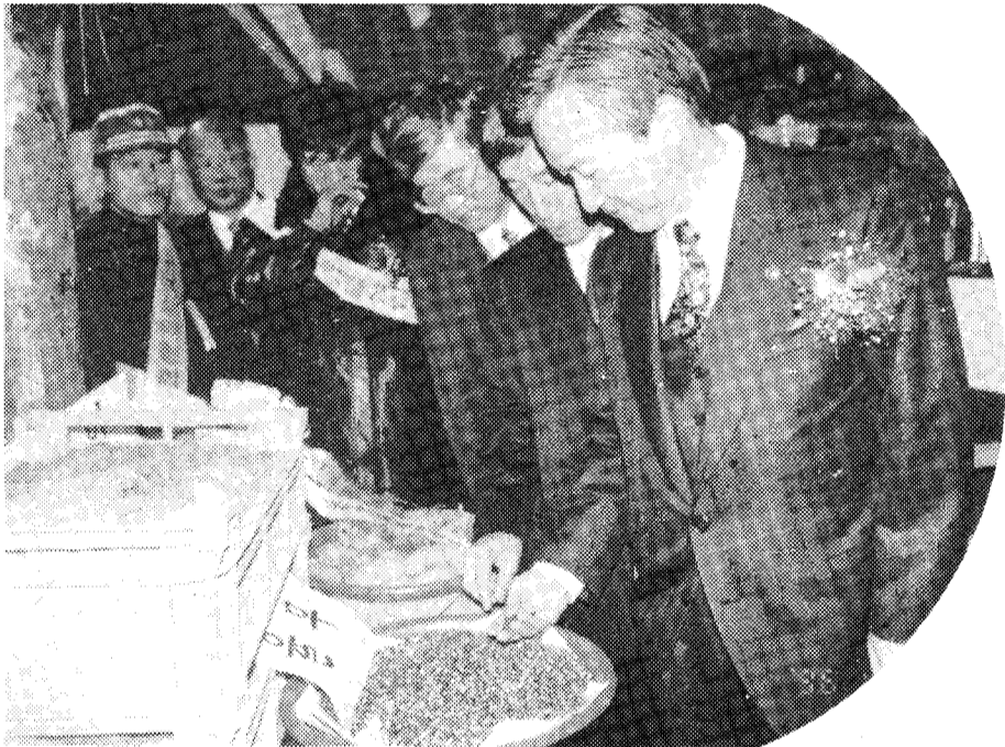
◇전시장 관람 강운태 전 농림부장관과 본회 이종용 회장이 경기도관에 전시된 재배복령과 울무를 관람하고 있다.