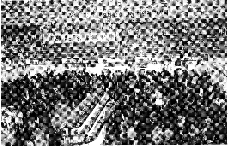
◇연일 대성황 행사첫날인 5일부터 마지막날인 11일까지 전시회장은 발디딜틈이 없을 정도로 연일 대성황을 이뤘다.

5 소 겨 나, 들 기 번 전시회 기간동안 2천여명의 생약재배 ... ○ 농민과 약 30만명의 소비자들이 전시장을 ... ○ 찾았다. 제3회 우수국산 한약재 전시회 ... ○ 행사 이모저모를 사진으로 꾸몄다. ... ○ <편집자 주> ... ○