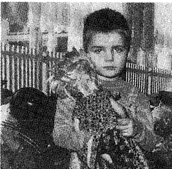
폴란드의 에이즈 고아

선진국에서의 아동 AIDS는 성인 AIDS의 추세를 따르고 있다. 가장 흔한 증세는 뉴모시스티스(pneumocystis) 폐렴이라 불리는 흔치 않지만