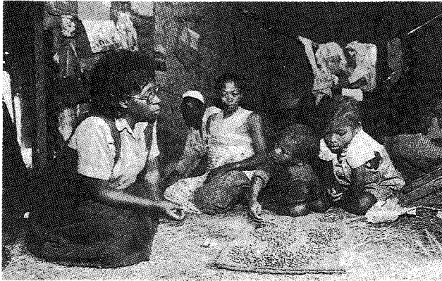
탄자니아의 에이즈 감염가족과 상담자

AIDS로 인해 고아가 된 어린이들을 후원하고 도와주려는 목적을 가진 지역 사회에 기반을 두고 활동하는 수천 개의 작은 규모의 단체가 있다. 그러나 많은 소규모 조직들이 이런 목적에 합당한 사업을 수행하는데 어