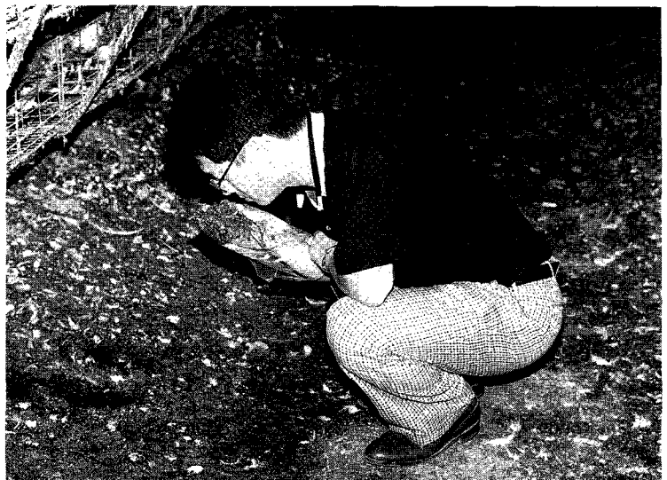
△ 생계분에서도 악취가 거의 나지 않는다.

본 기자가 청정사료를 급여하고 있는 계사안에 들어가 확인해 본 결과 외부 공기와 큰 차이를 못느꼈으며 계분에서도 전혀 냄새가 안나 계분에 다른 약제를 처리한 것 같은 느낌을 받을 수 있을 정도였다. 반사료를 급여하는 양계장과 비교하기 위해 옆 농장에 들어갔는데 같은 환기시설과 똑같은 구조임에도 불구하고 불쾌감을 느낄 정도였으며 계분 냄새를 맡는 순간 고개를 돌릴 정도로 심각함을 확인할 수 있었다.