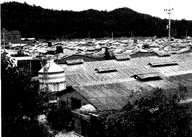
△ 90만수가 사육되는 희망농원 전경(게사가 뺨뺨히 붙어 있어 질병으로부터 무방비 상태인 것이 현실이다.)