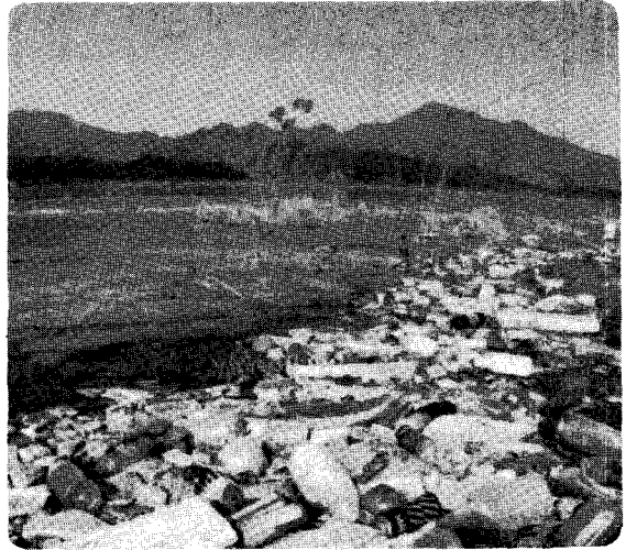
↑ 지난해 발생한 수질오염 사고 75건중 운전 및 취급 부주의로 인한 사고가 20건(26.7%)으로 가장 많았다.

3월 8일 환경부가 지난해 3월부터 12월까지 '환경신문고'를 통해 접수된 환경민원 현황에 따르면 전체 4만4