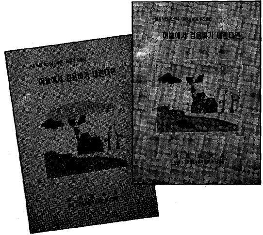
▲ (주)한국야쿠르트 논산공장의 환경자매학교인 덕은중학교에서 발간한 환경글짓기 모음집 「하늘에서 검은 비가 내린다면」.

지역사회의 환경보호를 위하여 기업체에서 1산1하천1학교가 운영될 수 있도록 우리 환경관리인들이 관심을 갖고 적극적으로 활동하여 주길 바라며 환경에 몸담고 있는 환경인으로서 지역의 환경보호에 조금이나마 도움이 되었으면 한다.