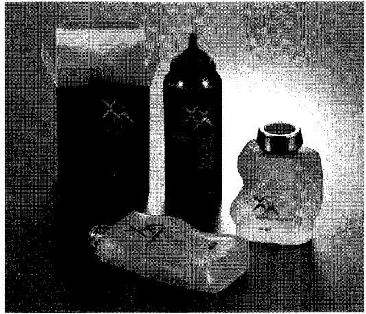
▲신세대의 이미지를 담은 태평양의 '트윈엑스 화장품'