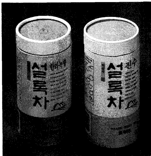
▲전통차의 새로운 디자인을 제시한 태평양 '설록차'