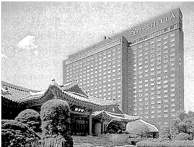
신라호텔은 삼성물산의 할인유통점 '홈플러스'에 '붐마뽕'이라는 브랜드로 입점한다.

데이앤데이에 대해 조선포텔은 "일단 성공적"이라고 평가한다. 분당 E마트점의 경우 평일 350만원, 주말 600~700만원의 매출을 올리고 있기 때문이다. 이 업체는 데이앤데이의 제품구성 방향을 놓고 상당히 고심한 것으로 알려졌다. 당초 호텔 베이커리의 아이টে็ม으로 접근하려다가 인접 장소가 할인점이라는 것을 고려, 대중적인 아이টে็ม으로 전환했다.