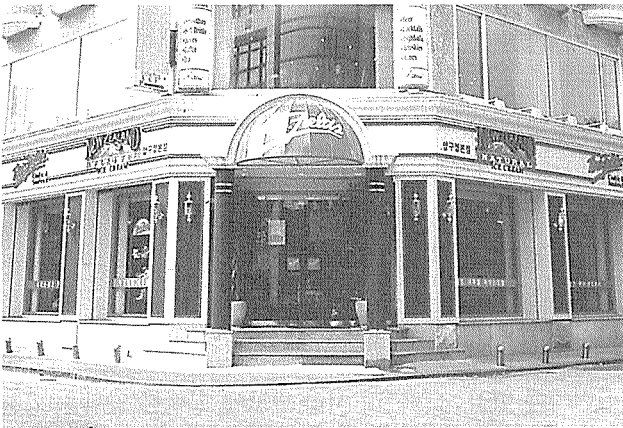
아미가호텔의 쿠키 및 아이스크림 전문점인 '미세스 휠즈' 압구정점.