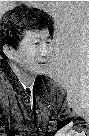
캔디 사랑의 뜨거운 열정을 지닌 구연회 부장