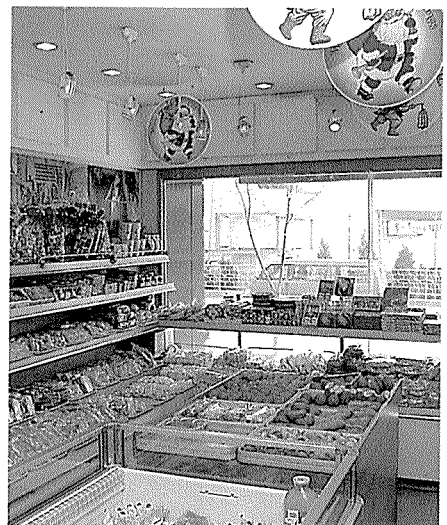
▲ 100여 품목에 이르는 다양한 제품으로 복잡한 고객의 성향에 부응함으로써 높은 경쟁력을 확보하고 있다.